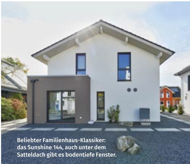
Beliebter Familienhaus-Klassiker: das Sunshine 144, auch unter dem Satteldach gibt es bodentiefe Fenster.

Entwurf Sunshine 144, MH Poing Außenmaße 9,96 m × 8,71 m Wohnfläche 149,88 m 2 Kochen 11,47 m 2 Essen/Wohnen 31,92 m 2 Bad 11,06 m 2 Dach Satteldach, Neigung 25° Bauweise Holzständerkonstruktion in Großtafelbauweise Heizung Wohlfühl-Klima-Heizung Vorzüge Große Auswahl an Architekturbauteilen und Dachvarianten, KfW-Effizienzhaus 55, Smart Home Preis Ausbauhaus-Basic inklusive Bodenplatte ab 192.492 Euro Anbieter Living Fertighaus GmbH Telefon 06 61/987-100 E-Mail info@livinghaus.de